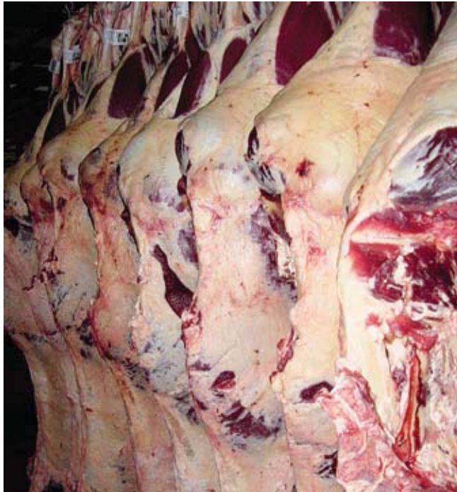
Só o Brasil pode multiplicar a oferta de carne bovina no mundo Only Brazil can multiply the beef supply in the world

De forma bastante positiva, os pecuaristas brasileiros e as entidades representativas já avançaram muito e têm um leque enorme de conquistas. As adaptações às exigências internacionais e internas de sustentabilidade e sanidade do rebanho bovino são dois exemplos marcantes. Adaptar-se é sempre um grande desafio, pois os Estados Unidos, por exemplo, têm necessidades diferentes dos países do Oriente