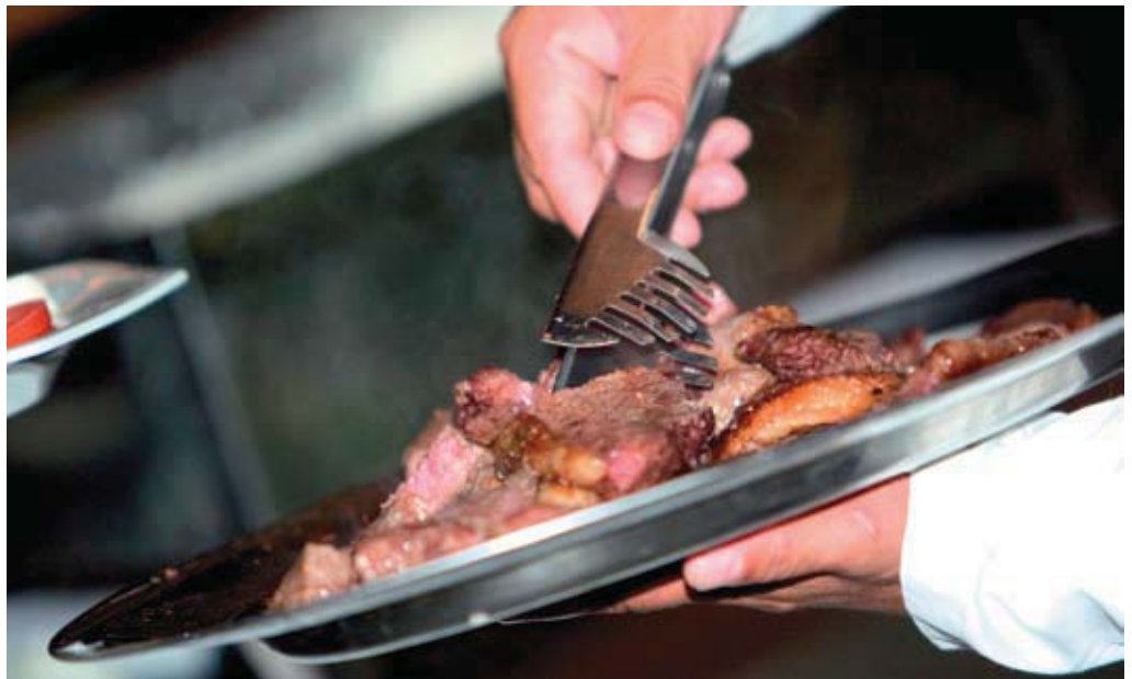
Carne brasileira é saborosa e ganha o mundo

B razil and the world have been going through several transformations when it comes to food. And this happens not only due to the commercial challenges between producers and buyers, but also because of the new requirements of the final consumers, which besides demanding high quality meat, also expect it to be produced according to several ethical, environmental and social standards.