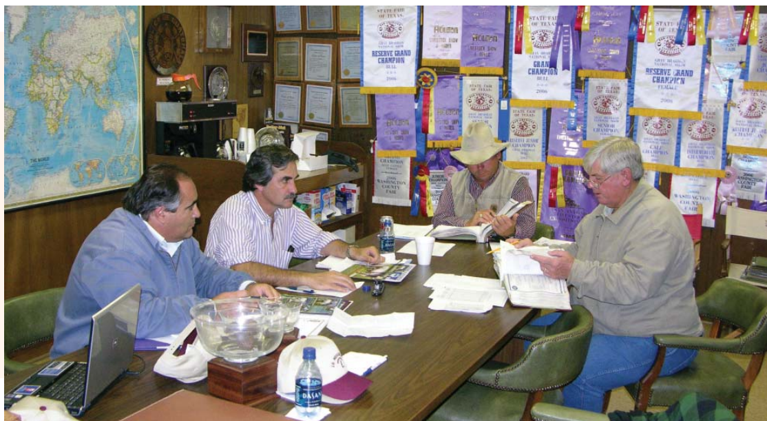
Brahman Hudgins: qualidade reconhecida internacionalmente Hudgins Brahman: worldwide quality