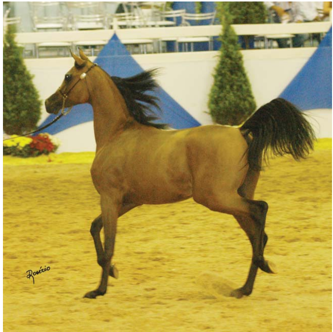
*FA El Shawan

Brazilian breeders of Arabian Horses exported 126 horses last year at prices varying from 10 to 450 thousand US dollars. This was the fourth consecutive year the market has seen business at this scale. The questions are: what's going on here, and how far can it go?