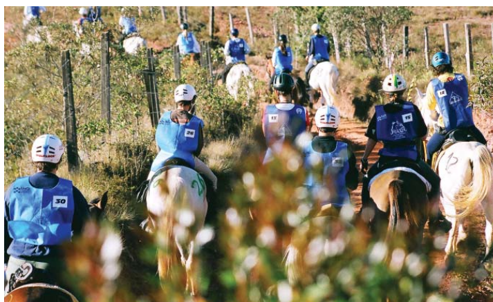
Momento da largada numa prova de Enduro

a ter maior representatividade e poder de investimentos no fomento da raça. Os sheiks Árabes dos Emirados e Arábia Saudita despertaram para a importância histórica da raça na cultura de seus países e vêm realizando grandes investimentos, aquecendo negócios principalmente na Europa. Finalmente e talvez o mais importante: o extraordinário crescimento do Enduro a cavalo, que segundo a FEI (Federação Equestre Internacional) é o esporte hípico que atualmente registra o maior crescimento em todo o mundo. E resistência para provas de 120 a 160 km em um só dia, nas quais são disputadas as mais importantes categorias do esporte, é especialidade exclusiva dos cavalos com sangue Árabe, principalmente os puros.