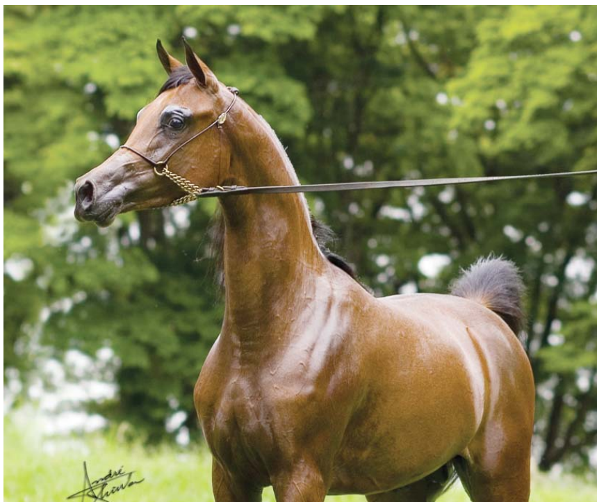
*FA El Shawan

Os criadores brasileiros do Cavalo Árabe exportaram no ano passado 126 cavalos com preços que variaram entre US$ 10 mil e US$ 450 mil. Esse foi o quarto ano consecutivo que o mercado proporciona negócios desta magnitude. As perguntas são: o que está acontecendo e até onde pode chegar?