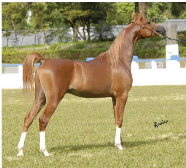
King Arthur FWM

A crescente expectativa dos brasileiros com um melhor desempenho econômico do país tem levado muitos criadores a olhar mais atentamente para seus cavalos, afinal parece que o período